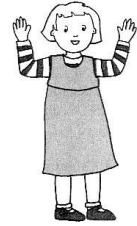
priez pour nous,

vocabulaire gestué : *Christ-Eucharistie **Pécheur ***Mort ****Amen • Je crois • C'est vrai