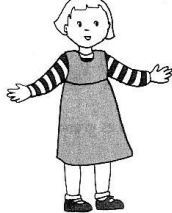
entre toutes les femmes