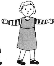
le Seigneur est avec vous.*