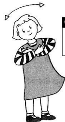
et Jésus, le fruit de vos entrailles, est béni.

vocabulaire gestué : *Inverse de « Terre et ciel » **Béni