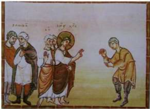
Evangélaire d'Egbert Xème siècle

Dans les évangiles, on voit à plusieurs reprises, Jésus qui guérit des lépreux. A cette époque, on connaissait mal cette maladie, mais on savait déjà qu'elle pouvait s'attraper au contact du malade. Celui-ci était alors exclu de la société et considéré comme impur. Pourtant Jésus va aller vers eux. Voici l'un de ces récits dans Saint Marc.