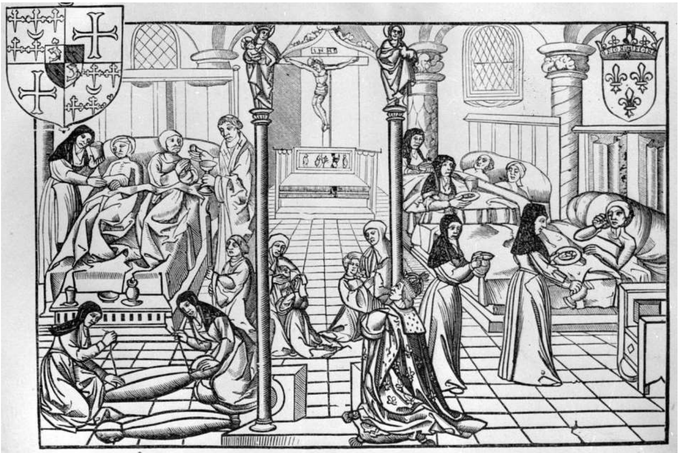
Une salle de l'Hôtel-Dieu de Paris (XVI ème siècle)

Observe cette gravure qui représente une salle de l'Hôtel-Dieu de Paris au XVI ème siècle