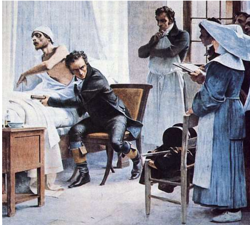
Auscultation de Laennec en 1816 (gravure de Le François d'après T Chartran)