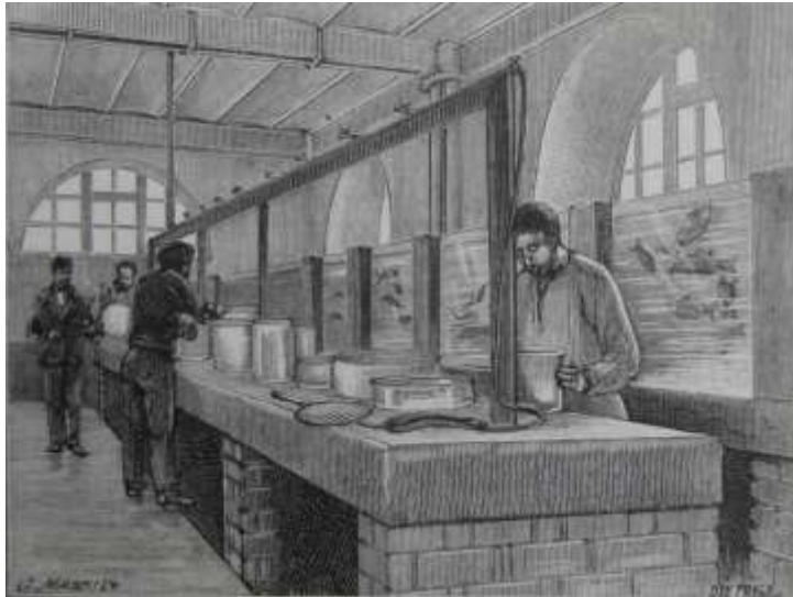
Le lazaret de l'île de Tatihou en Normandie