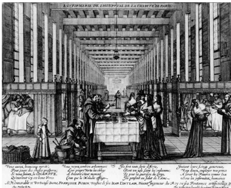
Paris, infirmerie de l'hôpital de la Charité (gravure d'A. Bosse vers 1635)

L'hôpital est aussi un lieu qui va permettre aux cours des siècles à la médecine de progresser