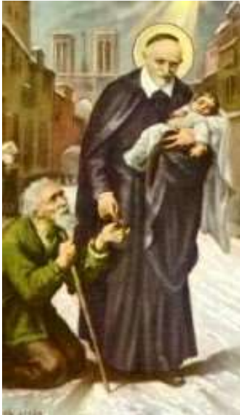
Saint Vincent de Paul

Le fondateur le plus célèbre est Monsieur Vincent . Avec lui, Louise de Marillac en 1627 et quelques filles dévouées et dames charitables commencent par faire des visites à l'hôtel Dieu à Paris puis vient la fondation de la Compagnie des filles de la Charité appelée communément sœurs de Saint Vincent de Paul. Elles apportent un renouveau de compétences et de dévouement.