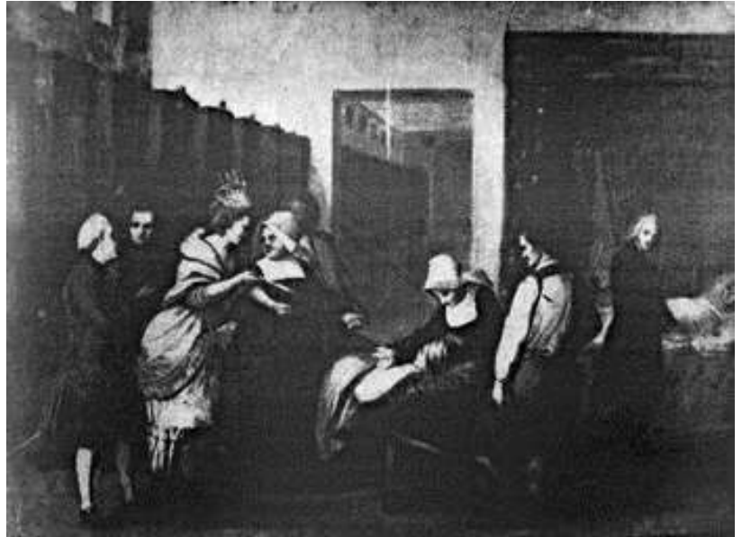
Visite de M et de Mme Necker à l'Hospice de la Charité, 1780

Quel évènement va donner un grand élan de charité au XVIème siècle ?