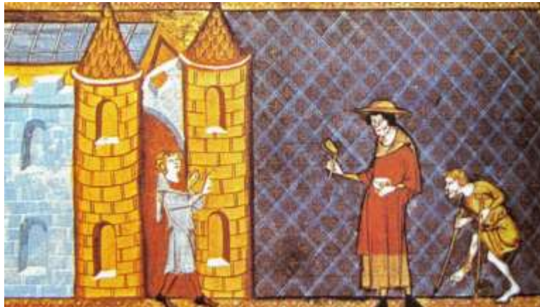
Deux lépreux demandant l'aumône, d'après un manuscrit de Vincent de Beauvais (XIIe siècle)

Au Moyen-Âge, on comprend peu le fonctionnement des maladies et on a du mal à les distinguer. Par rapport aux croyances de l'époque, il faut accepter les épidémies comme une punition divine : les péchés des hommes en sont la cause. On imagine parfois aussi qu'elles sont dues au vent, à la position des planètes... et pour tenter de les comprendre on interroge autant les astrologues que les médecins ! Du côté des soins, les saignées , peu efficaces et qui épuisent le malade, sont un des remèdes de référence. On élabore des traitements parfois plus dangereux que la maladie elle-même, et les charlatans ne manquent pas.