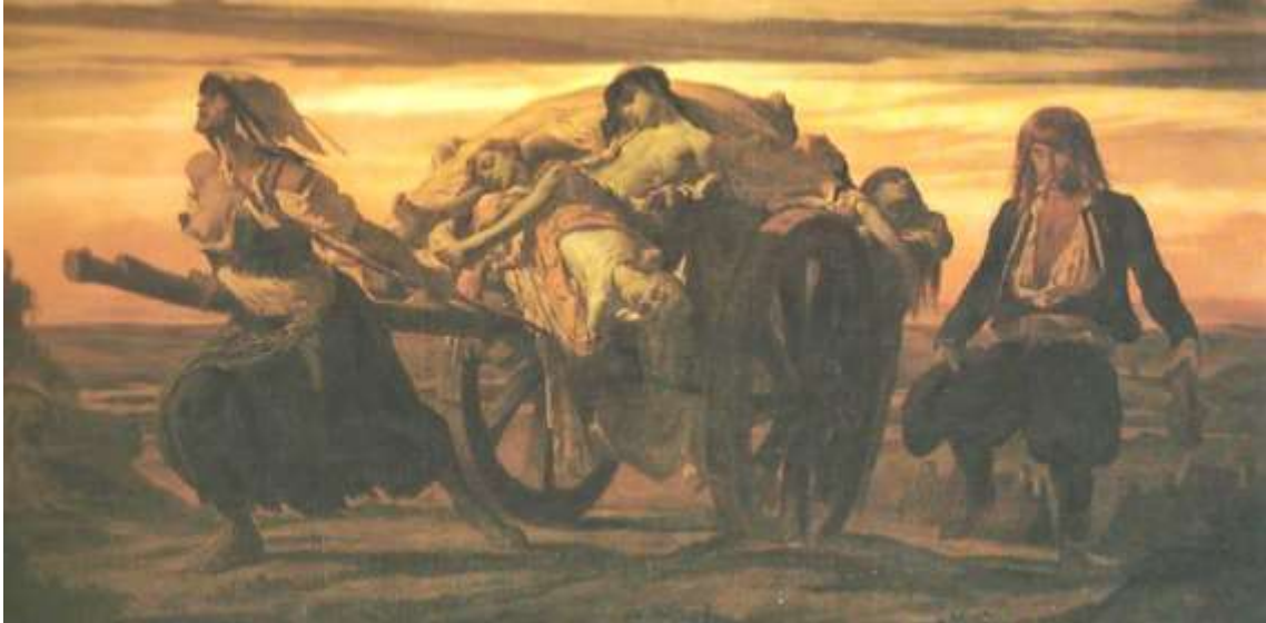
Louis Duveau, La peste d'Elliant (1849) Musée des Beaux-Arts de Quimper

Quand une épidémie commence à frapper, les conséquences sont énormes. La peste fera, entre le XIV e et le XVIII e siècle , 25 millions de victimes en Europe soit un tiers de la population. Elle bouleverse la société : les guerres s'arrêtent car il n'y a plus de soldats, les cérémonies religieuses cessent faute de prêtres, il n'y a plus personne non plus pour rendre la justice... Un vrai chaos ! En Bretagne, la région a été lourdement touchée. C'est la première fois que dans l'histoire on place les patients en quarantaine