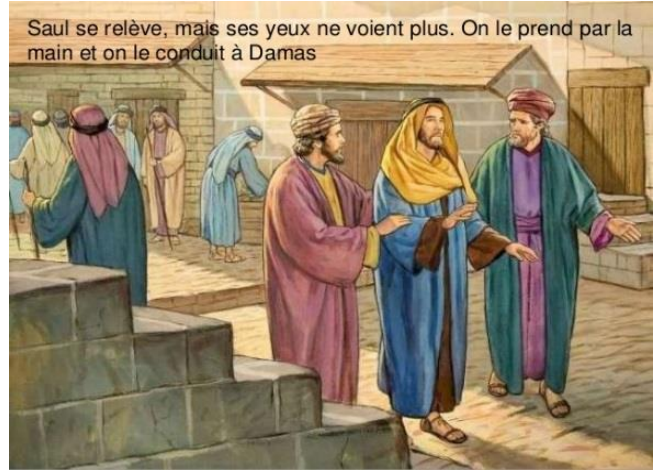
Saul se relève, mais ses yeux ne voient plus. On le prend par la main et on le conduit à Damas