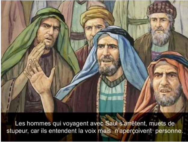
Les hommes qui voyagent avec Saul s'arrêtent, muets de stupeur, car ils entendent la voix mais n'aperçoivent personne.

Pendant trois jours il reste aveugle ; il ne mange pas et ne boit pas.