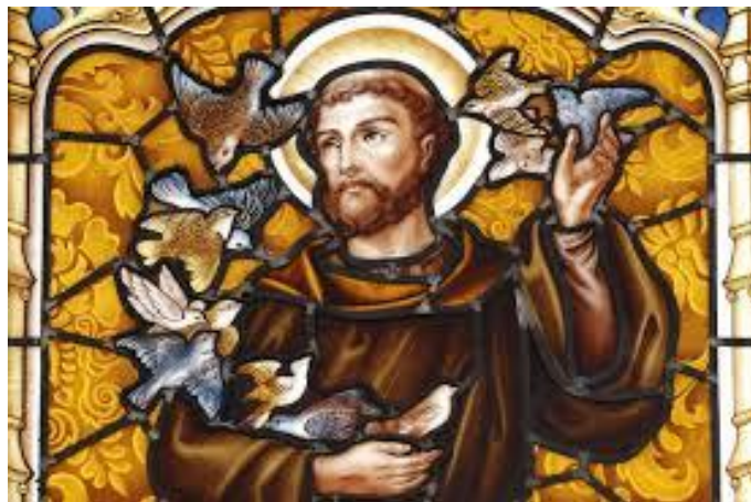
Saint François d'Assise, fondateur de l'ordre franciscain

En 1208, François , fils d'un riche marchand entend l'évangile : « Allez proclamer que le Royaume de Dieu est proche. N'emporter ni or, ni argent... », c'est une révélation pour lui. Saint François sera un des saints le plus populaire du Moyen Age. Claire suivra l'exemple de François et avec ses compagnes fondera l'ordre des Clarisses .