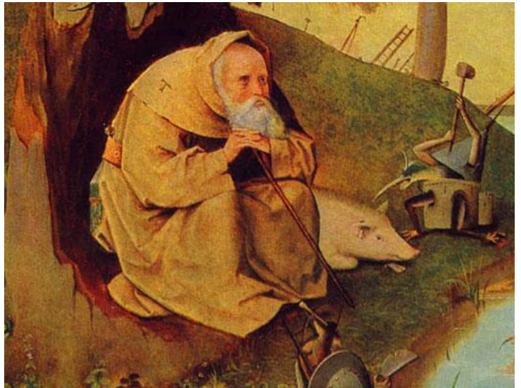
Saint Antoine le Grand, le père de tous les moines

A l'origine, le choix de la virginité et de la chasteté pour le Royaume a été un honneur dans les communautés chrétiennes (cf Mt 19,12 ; 22,30 Paul 1 Co 7). Des jeunes filles choisissent de rester vierges et prophétisent comme les filles de Philippe (Ac 21, 8-9). Petit à petit on voit des chrétiens prêts à tout quitter pour le Royaume. On les appelle moine (de monachos : solitaire), ermite (de éremos : celui qui vit au désert, à l'écart des hommes) ou ce qui est presque identique anachorète (de anachorein : se retirer). Puis quelques-uns décident de se retirer mais en ayant une vie commune, on les appellera les cénobites . Enfin on finit par désigner sous le terme de monachisme l'état de vie de tous ceux qui quittent le monde pour se vouer à Dieu pleinement.