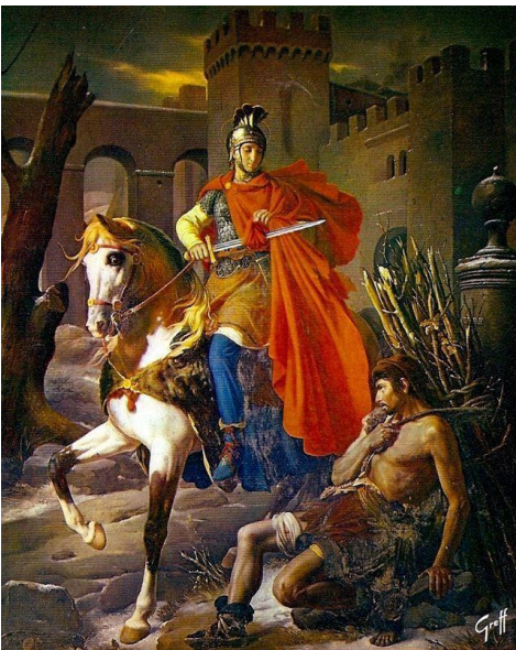
Saint Martin, partageant son manteau

On trouve quelques grandes figures comme Saint Antoine (251-356), ermite qui vit dans le désert, Saint Basile qui demande aux moines de vivre en communauté. Saint Pacôme , ermite égyptien (292-346) fonde le premier monastère dans la région de Thèbes. Sa sœur Marie va fonder une communauté de femmes, c'est l'apparition des moniales. En 361, Martin de Tours fondera le premier monastère de Gaule à Ligugé près de Poitiers. Saint Jérôme traduira la bible du grec en latin (la vulgate). Saint Benoît (480-547) fera une règle qui va inspirer presque tous les monastères d'occident jusqu'au XII ème siècle.