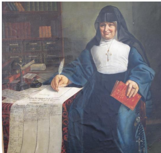
Anne Marie Javouhey, missionnaire et fondatrice des sœurs de Saint Joseph de Cluny a lutté contre l'esclavagisme