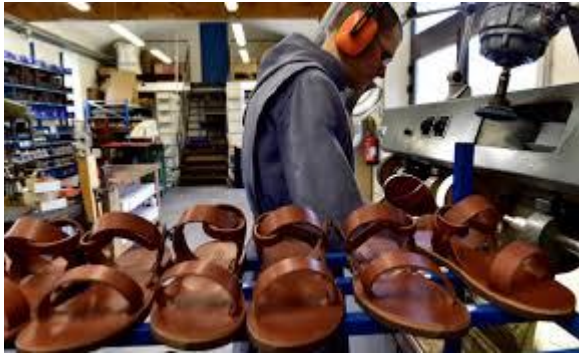
Moine bénédictin en train de fabriquer des sandales de cuir

Ils ou elles vivent une vie de prière, dans l'amour du Christ, après avoir fait vœux de chasteté, pauvreté et obéissance. Les journées sont rythmées par l'Eucharistie et les Offices, la lecture spirituelle et l'oraison, le travail manuel et les services pour les besoins de la communauté et le partage avec les pauvres.