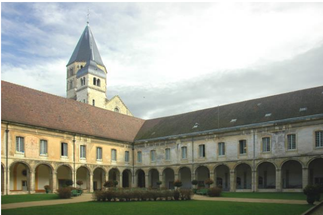
L'abbaye de Cluny

Des réformes vont avoir lieu au court du moyen âge dans la vie de l'Eglise et les moines vont y jouer un rôle déterminant. Des monastères célèbres vont fonder d'autres abbayes qui seront sous leur autorité. C'est le cas de l'abbaye de Cluny fondé en 910 qui suit la règle des bénédictins . En 1084, Saint Bruno fonde la Chartreuse qui associe vit érémitique et communautaire (solitude et simplicité dans la relation à Dieu).