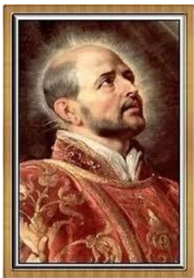
Sainte Ignace de Loyola, fondateur de la compagnie de Jésus (les jésuites).

Après la réforme protestante et des guerres de religions qui ont déchirés les chrétiens d'Europe, un renouveau catholique aura lieu grâce au Concile de Trente aux XVIème et XVIIème siècles. De nombreux collèges et séminaires seront fondés et on verra un essor des ordres religieux.