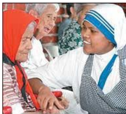
Fille missionnaire de la Charité, (congrégation fondée par Mère Teresa) auprès de personnes âgées

Ils ou elles vivent en communautés implantées dans des lieux divers, dans leur pays ou au loin (mission). Ils ou elles sont ouverts(es) à tous les services dans la société ou dans l'Église, en priorité au service des plus pauvres : enseignement, monde de la santé, prisons, œuvres sociales... Ils ou elles s'engagent par des vœux faits en public. Parmi eux, certains sont prêtres. Au sein de leur communauté, ils vivent l'amour fraternel et la prière.