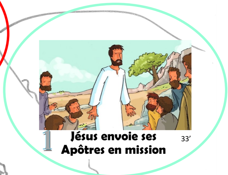
1 Jésus envoie ses Apôtres en mission 33'