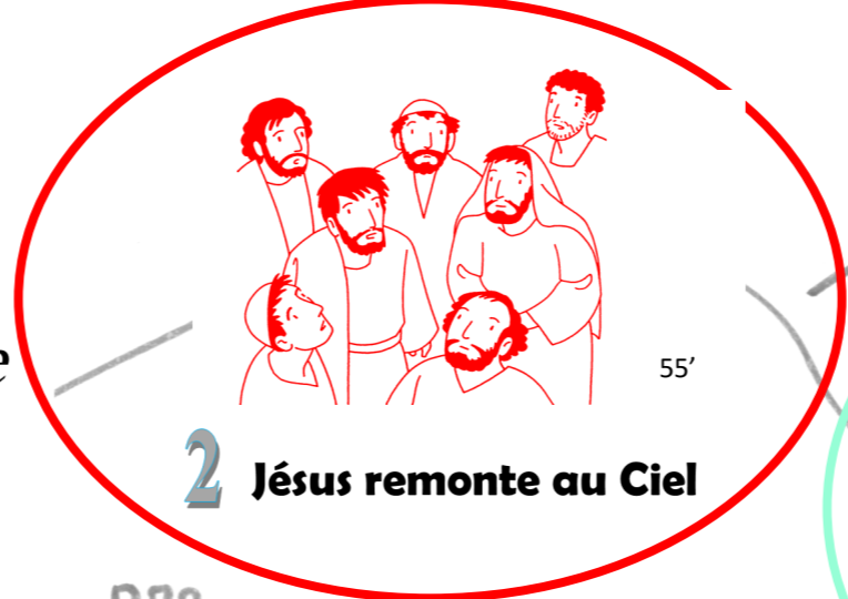
2 Jésus remonte au Ciel 55'