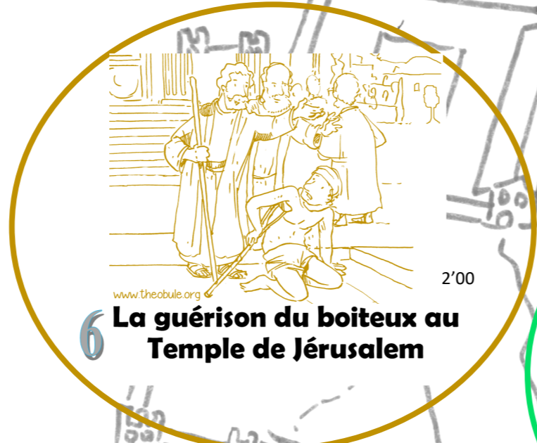
6 La guérison du boiteux au Temple de Jérusalem 2'00