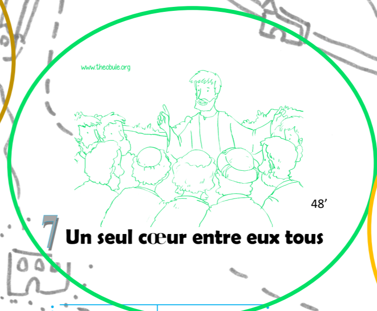
7 Un seul cœur entre eux tous 48'