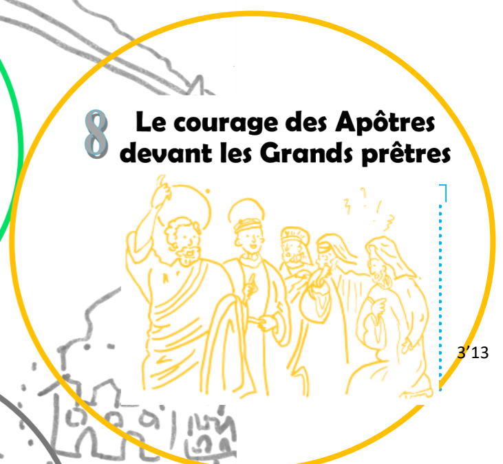
8 Le courage des Apôtres devant les Grands prêtres 3'13