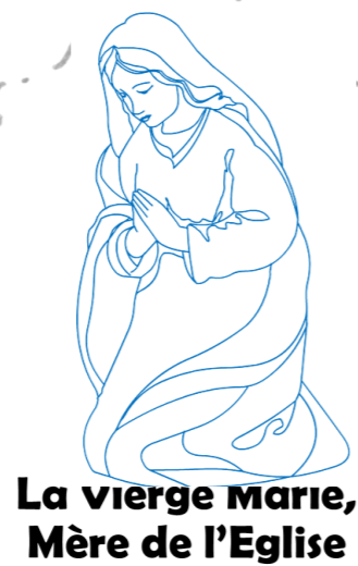
5 La vierge Marie, Mère de l'Eglise

Depuis les 10 jours de prière au Cénacle dans l'attente du don de l'Esprit Saint, tous regardent Marie comme leur mère : la mère de tous ceux qui croient en Jésus. Et elle, comme une mère, prie pour chacun des Apôtres et tous ceux qui connaîtront le Salut grâce à eux.