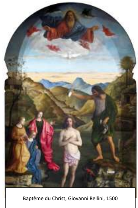
Baptême du Christ, Giovanni Bellini, 1500