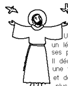
Saint Francois d'Assise 1182

Tressaillez de joie ! Tressaillez de joie ! Car vos noms sont inscrits Pour toujours dans les Cieux ! Tressaillez de joie ! Tressaillez de joie ! Car vos noms sont inscrits dans le cœur de Dieu !