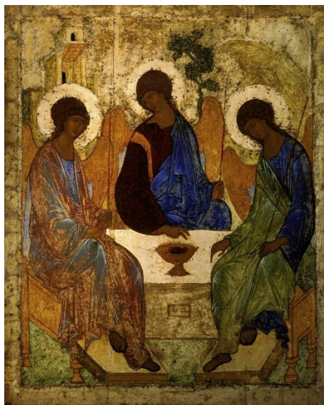
d'Andrei Roublev, 1425