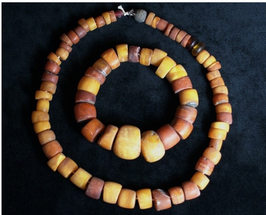
Gougad patereu ou Talisman de Saint Jean, entre 1875-1905, Carnac