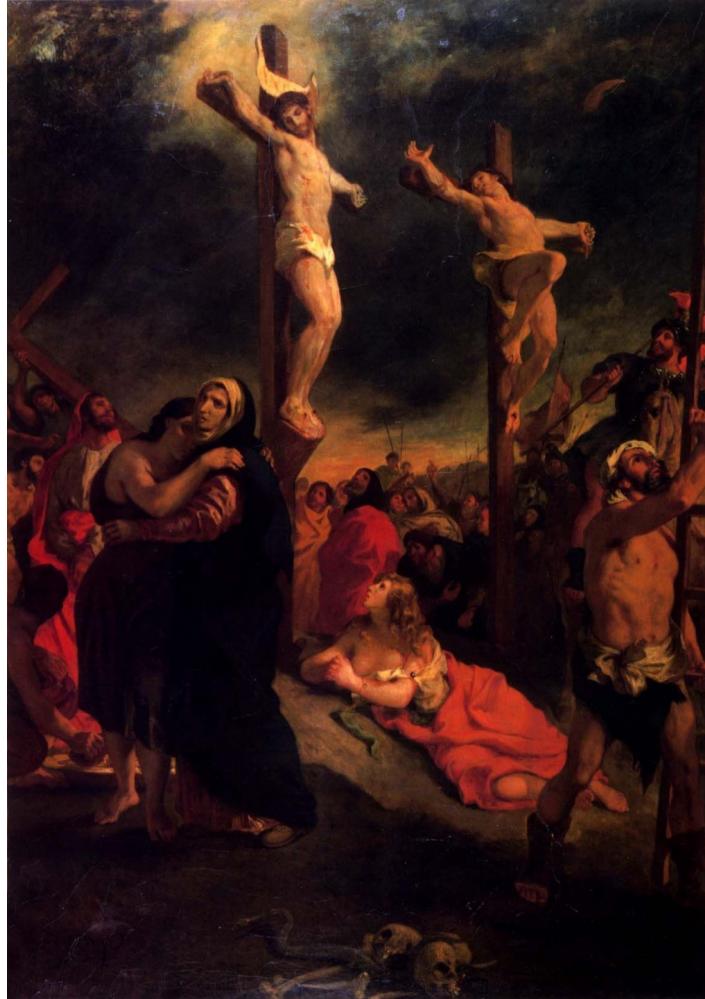
Le Christ en Croix, Eugène Delacroix, musée des beaux arts La Cohue, Vannes