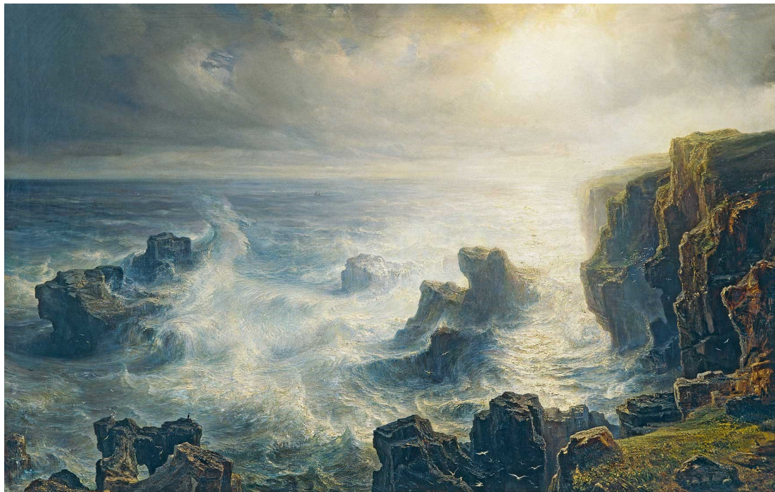
Tempête sur les côtes de Belle-Île, Théodore Gudin, Quimper