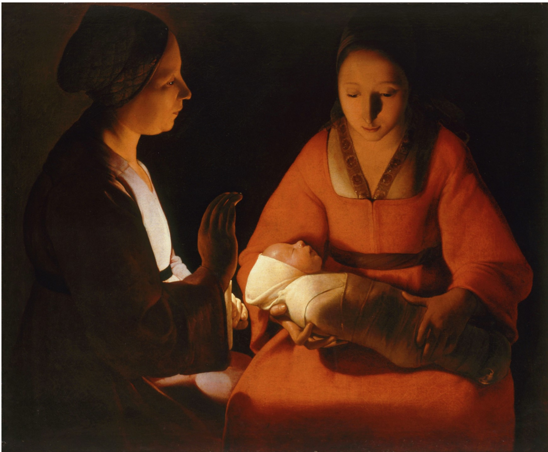
Le Nouveau-né, Georges de La Tour, Rennes

Thierry Laruelle, animateur pédagogique « Arts et culture » propose une série d'œuvres d'art en lien avec le thème de Trans'arts « Patrimoine » : les chefs d'œuvre des musées bretons.