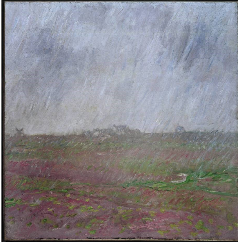
Pluie sur Belle-Île, Claude Monet, Morlaix