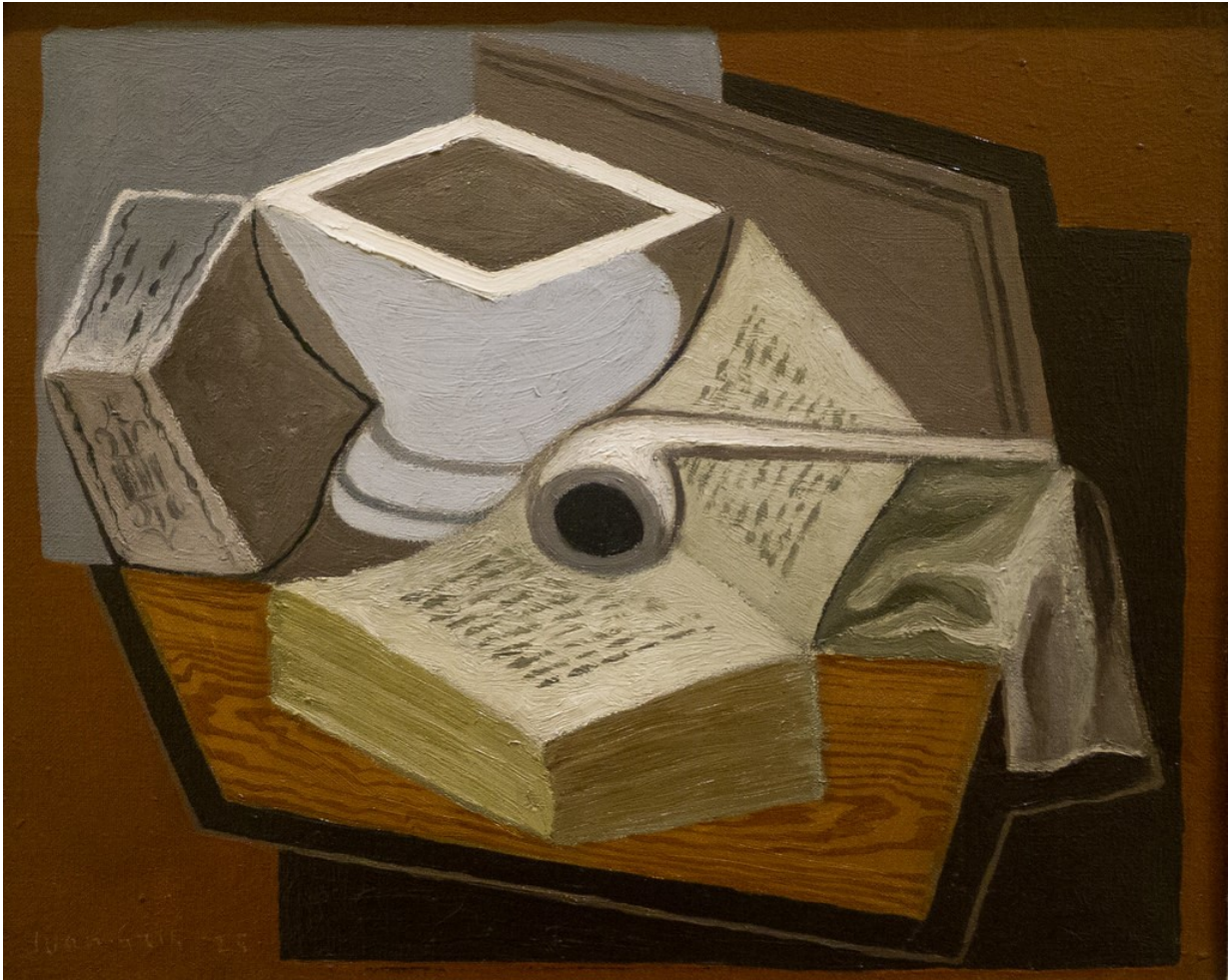
Le livre ouvert, Juan Gris, Rennes