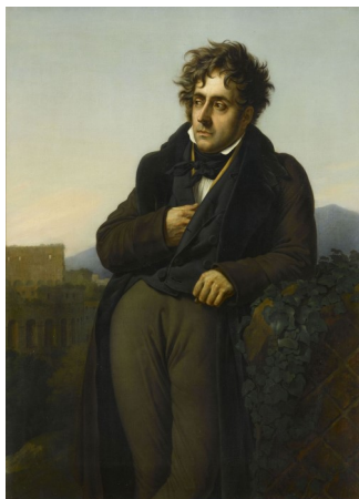
Chateaubriand, Homme méditant sur les ruines de Rome, Anne-Louis Girodet-Trioson, Saint-Malo