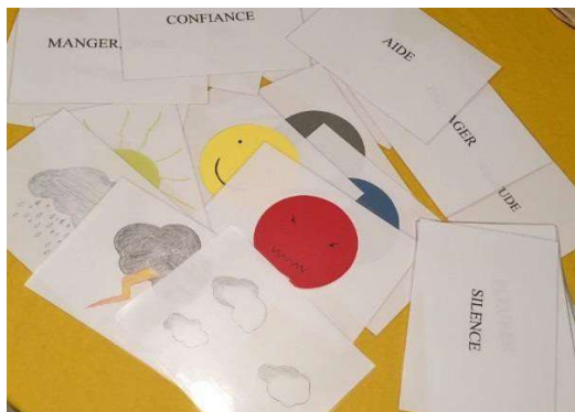
Les trois phases de l'outil « émotion ».

- pouvoir mieux gérer ses émotions en comprenant mieux ce qui les déclenche.