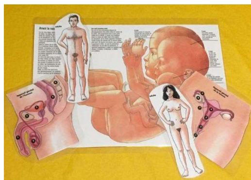
Quelques éléments de l'outil « puberté, transmission de la vie »

- se rassurer devant toutes les transformations de la puberté, en s'émerveillant devant tout ce que met le corps humain au service de la transmission de la vie.