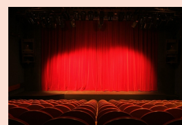
Festival de théâtre