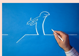
Rencontres du film d'animation