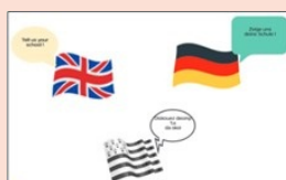
Concours "Fais nous visiter ton quartier"