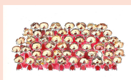
Rassemblements de chorales