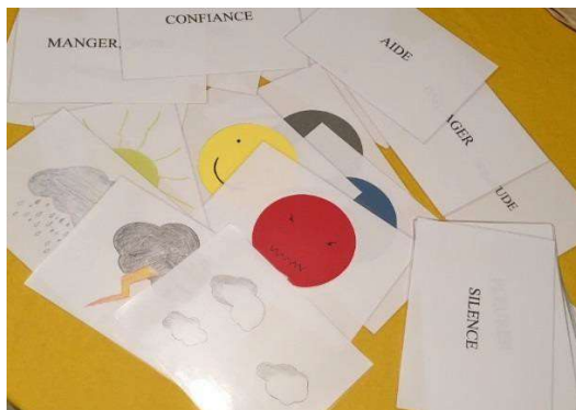
Les trois phases de l'outil « émotion ».