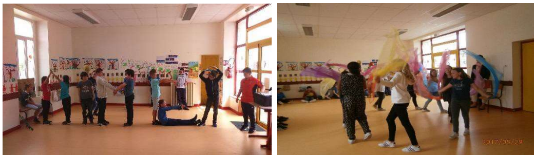
Atelier « scène » : Les garçons et les filles en préparation.

« L'Enseignement Catholique déploie son action éducative selon une vision chrétienne de l'Homme : créé à l'image de Dieu, l'Homme est un être de relation. Unique et porteur d'une inaliénable dignité, il assume sa nature humaine et sexuée, homme ou femme, dans toutes les dimensions de sa personne : cœur, corps, âme, esprit. Il est appelé au don et à la communion. »