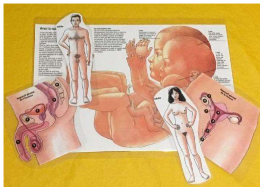
Quelques éléments de l'outil « puberté, transmission de la vie »