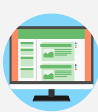
Visibilité sur le site DDEC 56

Préparez le contenu de vos supports de communication et envoyez les informations suivantes à ana.morice@e-c.bzh :