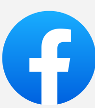
Publication sur Facebook FSP