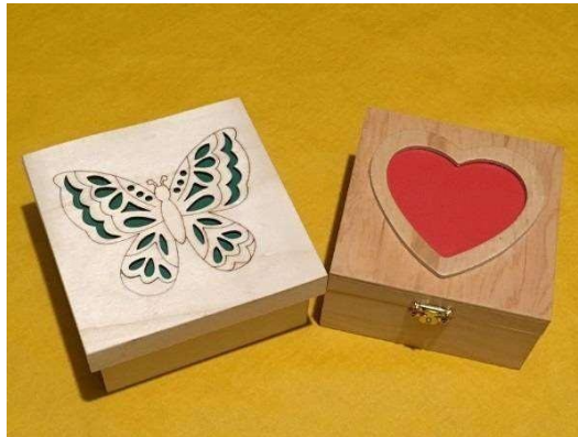
Un des trois outils « estime de soi. »