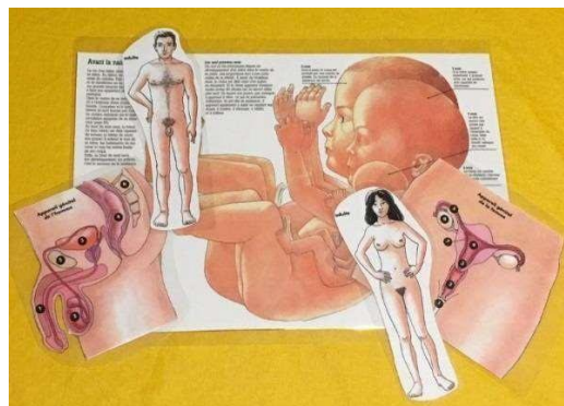
Quelques éléments de l'outil « puberté, transmission de la vie »