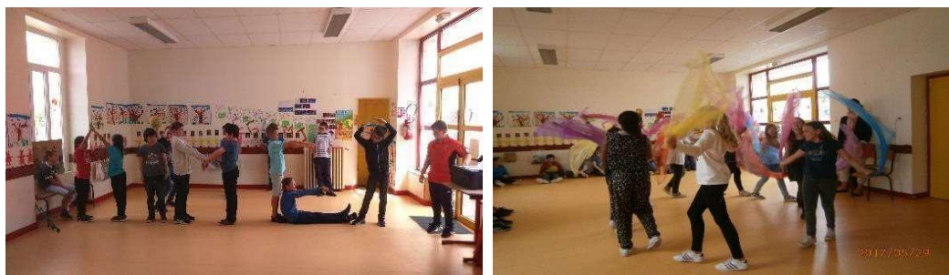
Atelier « scène » : Les garçons et les filles en préparation.

« L'Enseignement Catholique déploie son action éducative selon une vision chrétienne de l'Homme : créé à l'image de Dieu, l'Homme est un être de relation. Unique et porteur d'une inaliénable dignité, il assume sa nature humaine et sexuée, homme ou femme, dans toutes les dimensions de sa personne : cœur, corps, âme, esprit. Il est appelé au don et à la communion. »