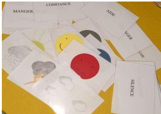
Les trois phases de l'outil « émotion ».