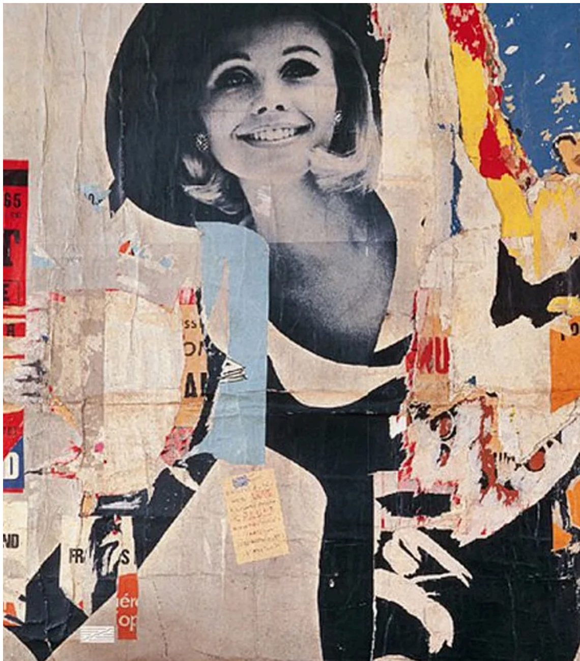
Jacques Villeglé, Rues Desprez et Vercingétorix - La Femme, 1966