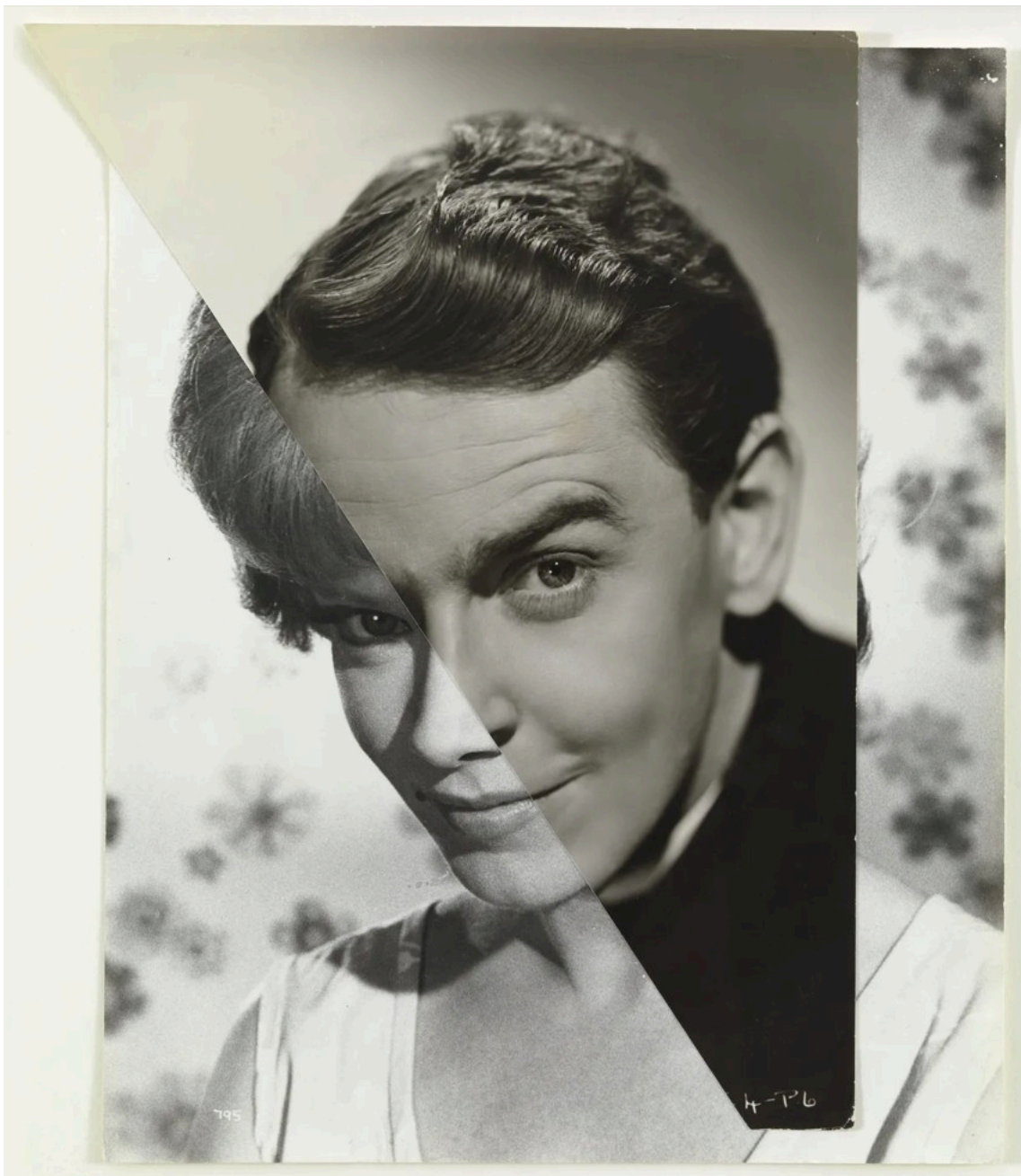
John Stezaker, Marriage XV, 2006