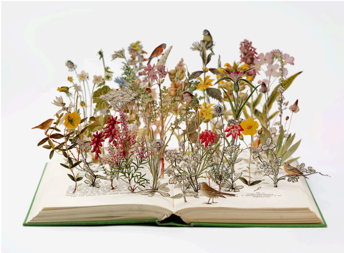
Nature in Britain, 2012, Su Blackwell

Thierry Laruelle vous propose de découvrir chaque semaine une œuvre en lien avec "Trans'arts : Papier".