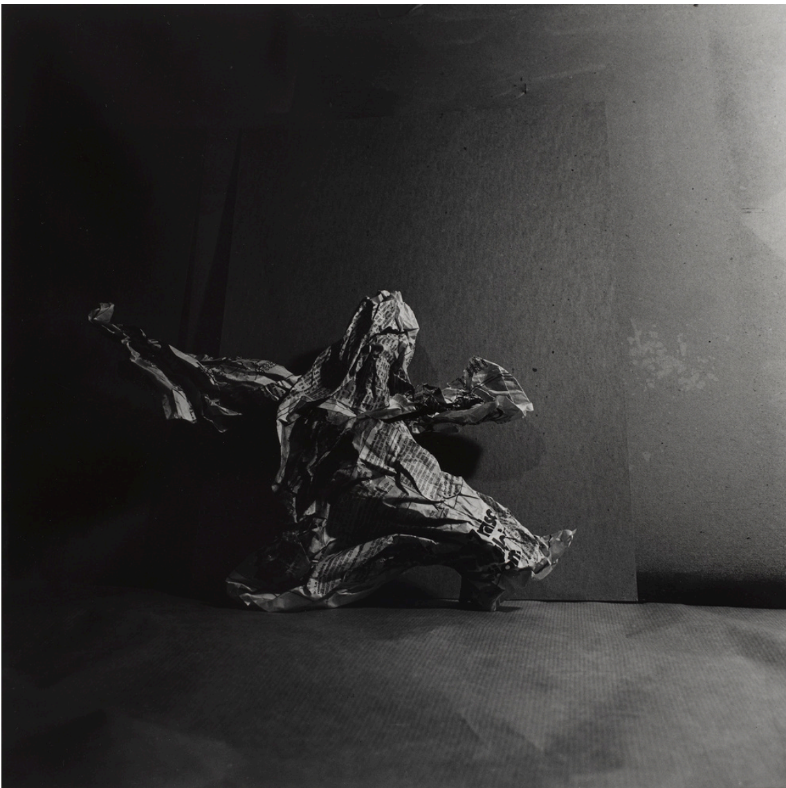
Tom DRAHOS - Papiers froissés - 1980